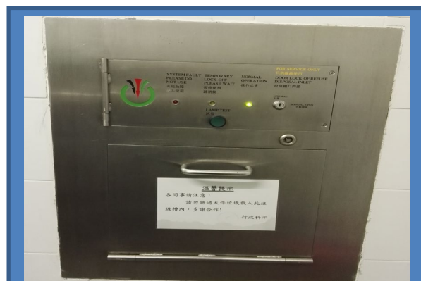
透過工業貿易大樓內的垃圾收集系統收集普通廢物，以便將廢物循環再造和減少升降機載重。