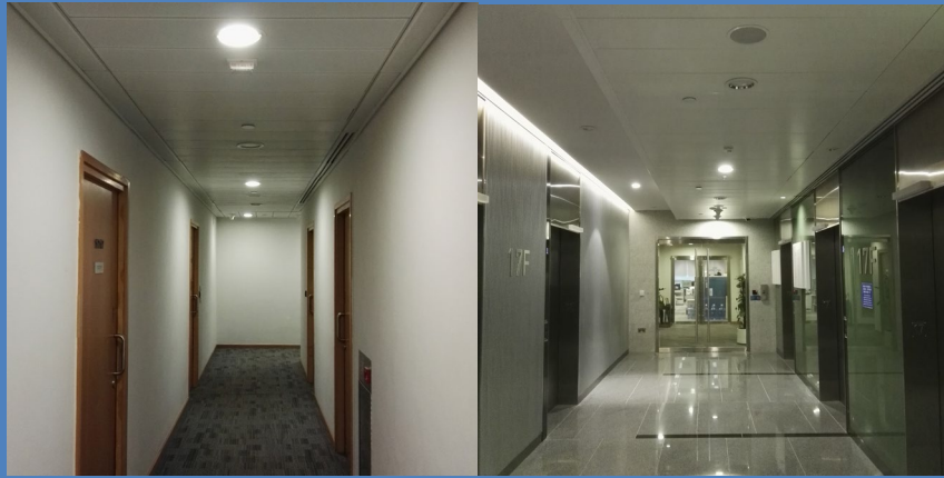
公眾及公用地方於午飯和辦公時間後使用最少量的燈光。