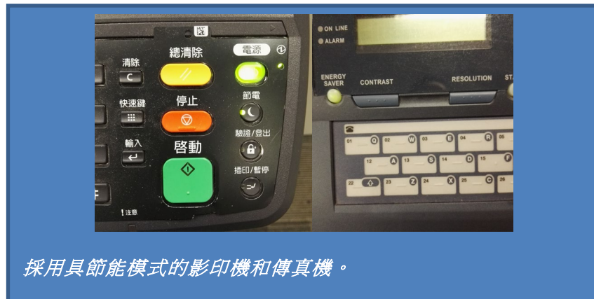
採用具節能模式的影印機和傳真機。