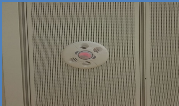
辦公室範圍內已安裝人流感應器，以推動節能。