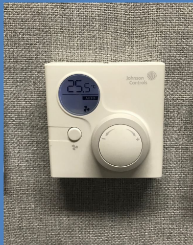
設定及維持室內溫度於攝氏25.5度以節省能源。