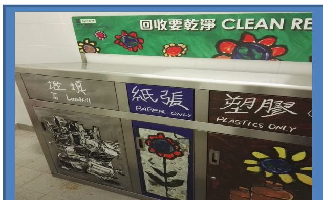
在工業貿易大樓內每一樓層的垃圾收集房放置廢物分類回收箱。