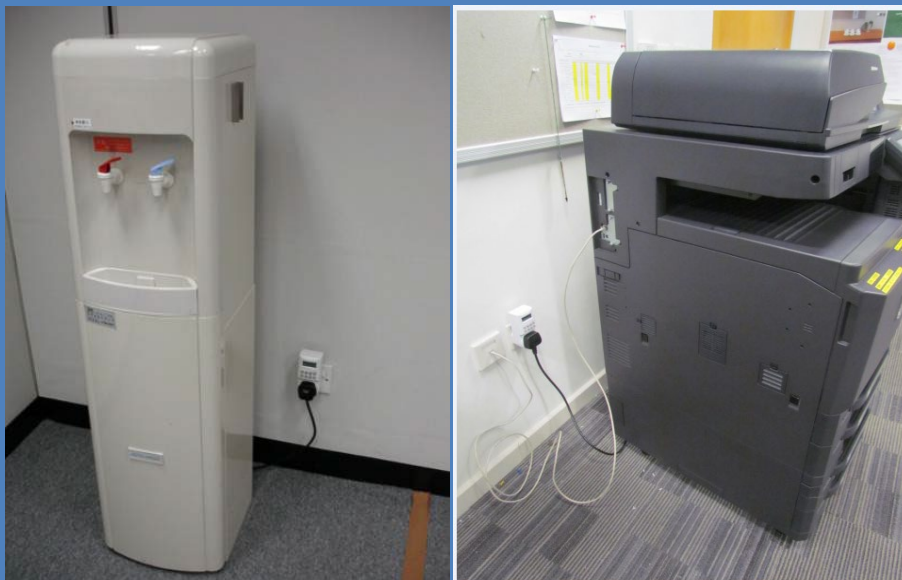
在蒸餾水機和影印機安裝時間掣，在辦公時間後自動關掉該等設備的電源。