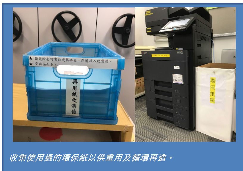
收集使用過的環保紙以供重用及循環再造。