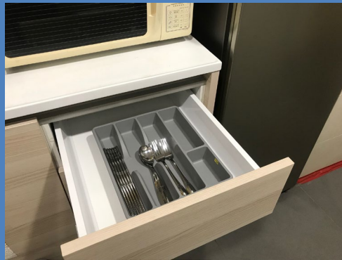
辦公室茶水間提供可重用的餐具予員工使用