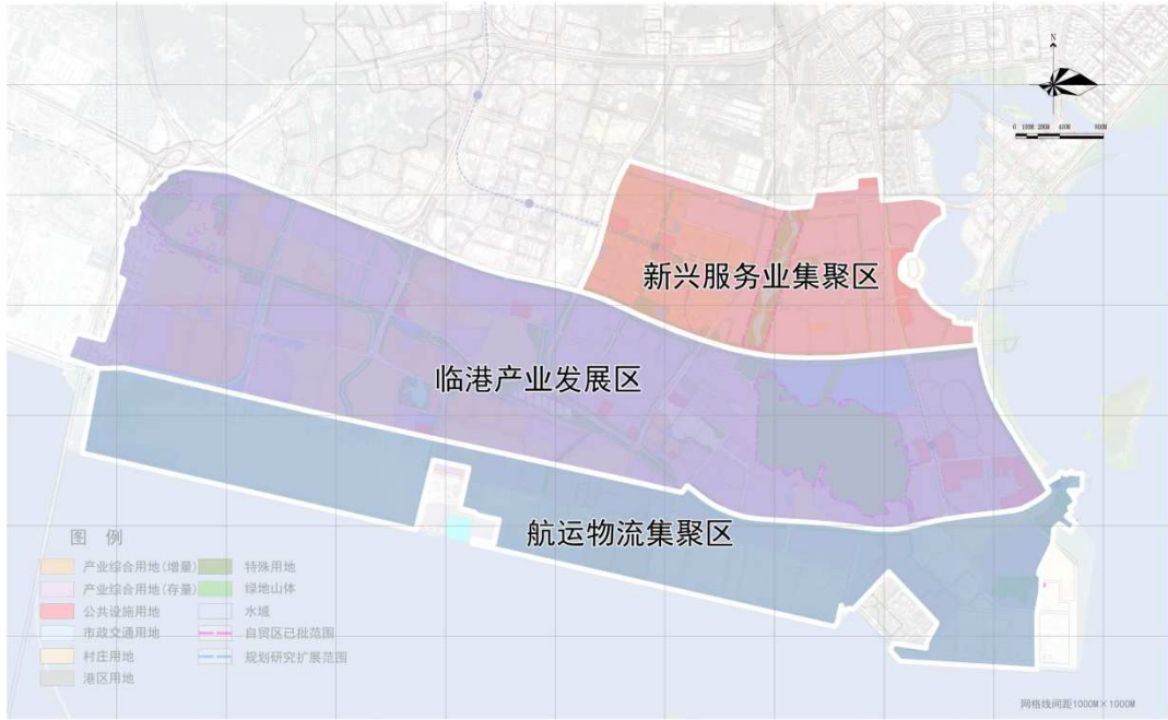
图3 东南国际航运中心海沧港区产业功能布局示意图

发展策略。注重区港一体，联动临港。一是提升港口航运服务功能，加快航运要素集聚。二是完善疏港通道以及物流用地规划，加快港口物流产业发展。三是适当规划建设商务载体，引进功能性项目和市场主体，发展航运金融、船舶管理等临港产业新业态。四是推进出口加工区转型升级，建设两岸青年创业基地，加快发展服务外包、加工增值等新兴产业。五是统筹规划远期发展区，加强保税功能与非保税功能联动。加强与临港地区的联动发展，依托临港地区拓展高端制造、研发创新、服务贸易、城市服务等功能。