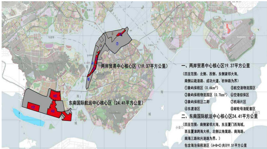
图1 自贸试验区区位示意图