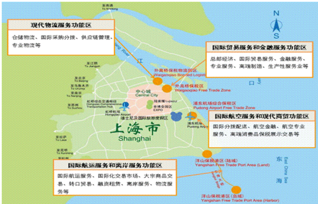
图 1 自贸试验区产业功能布局示意图