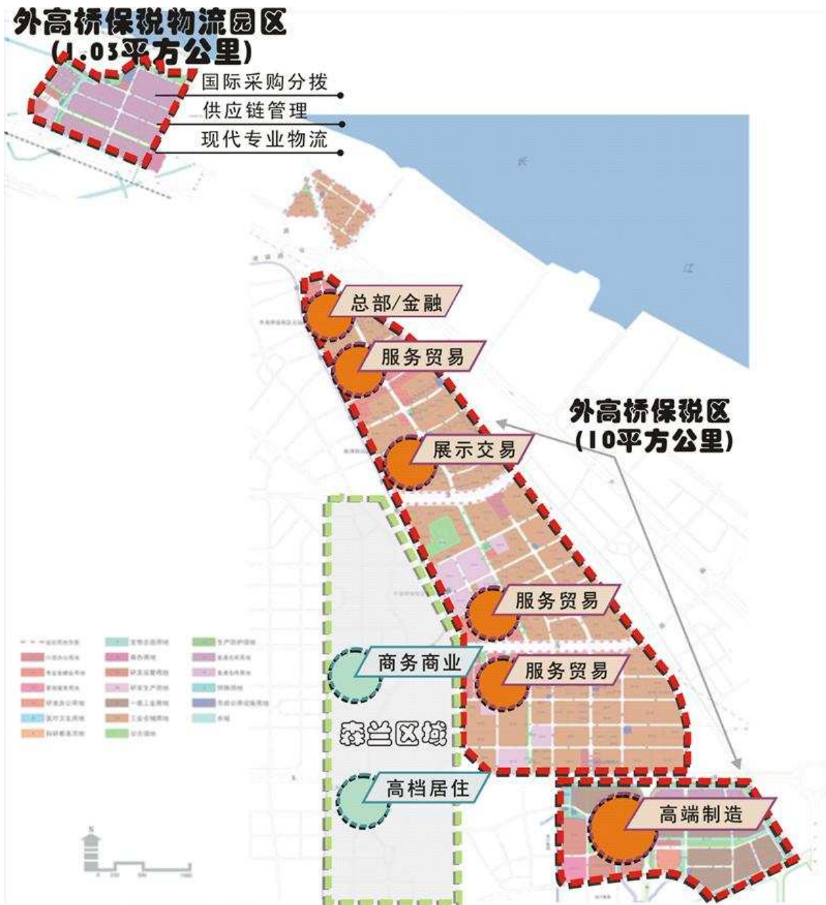
图2 外高桥保税区、外高桥保税物流园区产业功能布局示意图