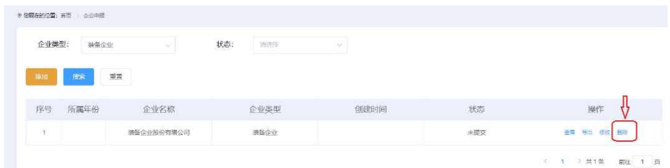
图 2-12 列表页面-删除

1.如果已经填报申报数据，需要在列表页面点击【删除】按钮将数据删除。包括删除暂存的未提交数据。否则再次点击【添加】按钮时会做出提示，政策规定：一家企业一个年度只能以一种企业类型提交申请。