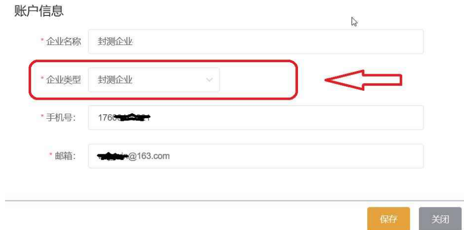
图 2-13 账号信息-修改企业类型

3.重新添加数据。修改“企业类型”后，回到列表页面，点击【添加】按钮，即可进入到新的申报页面。