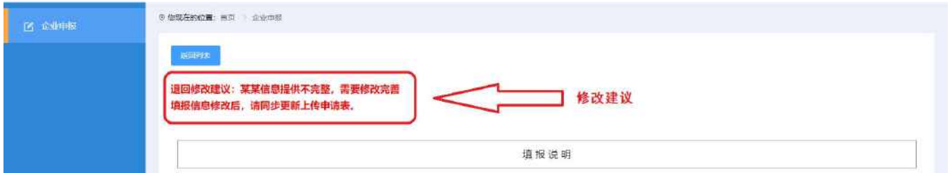
图 2-4 企业申报-退回修改