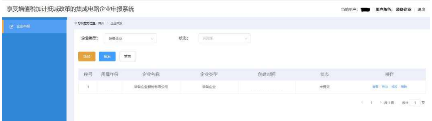
图 2-3 企业申报-列表页面

特别建议：因填报和提交的扫描文件较多，相关内容可能需要企业多个部门协同完成。因此建议正式申报之前，应点击【添加】按钮，记录申报页面需要填报和提交的扫描文件，分发给各部门筹备，指定负责人收集相关资料后统一进行申报操作。