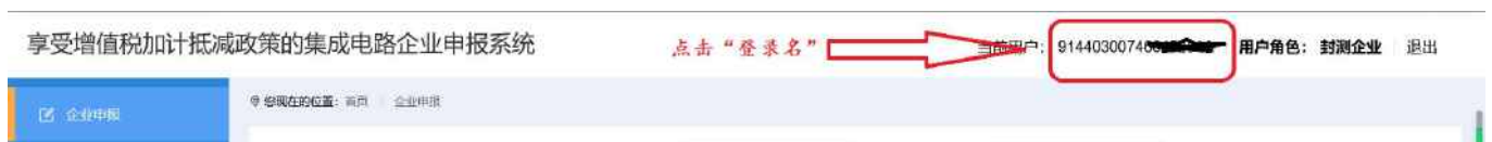
图 2-10 账号信息-页面

企业名称、企业类型、手机号、邮箱等账号信息需要修改时，可以点击右上角顶部的登录名进入修改页面。