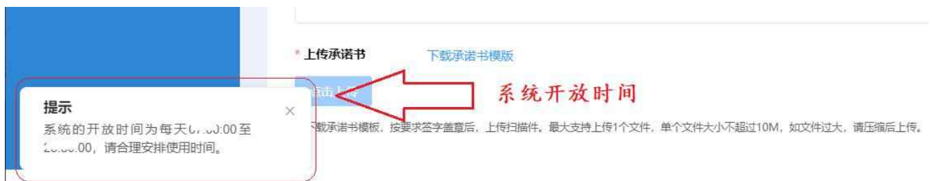
图 2-9 系统开放时间

点击“企业申报”模块名称，进入列表页面。点击【添加】按钮进入信息填报页面。请认真阅读“填报说明”关于填报时间、政策要求等相关信息。申报企业应在规定时限内提交申报材料，逾期系统将关闭通道。同时，本系统会结合实际工作安排，适时关闭夜间访问，请申报企业合理安排使用时间。