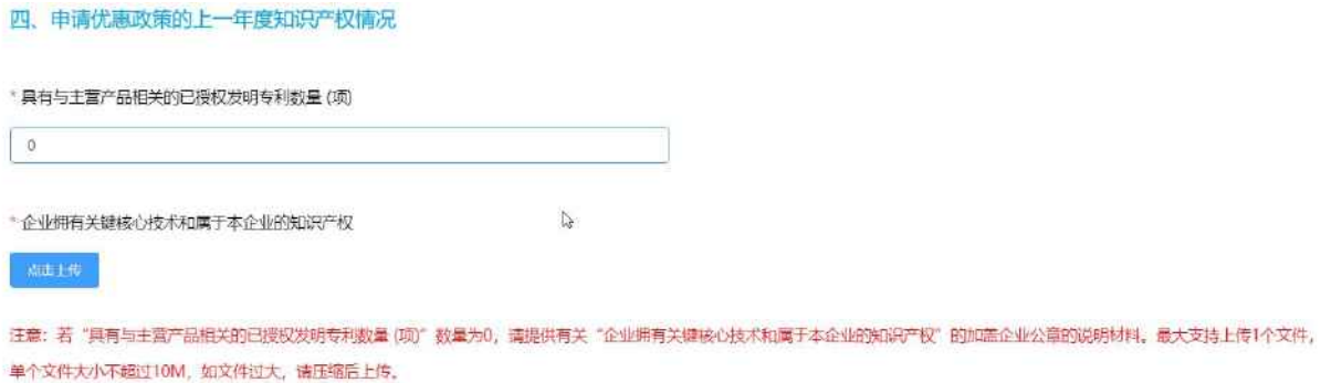
图 2-6 知识产权信息

请提供有关“企业拥有关键核心技术和属于本企业的知识产权”的加盖企业公章的说明材料。